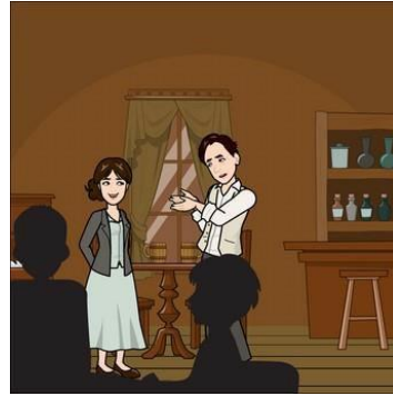
"Ach níl sé innharthana", arsa na Gaeilgeoirí cróga, "Nach bhfuil an Ghaeilge le feiceáil ar oiread is fógra, is nach bhfuil sí le cluinsint á spalpadh amach, In áiteanna poiblí sa stát Oiristeach."