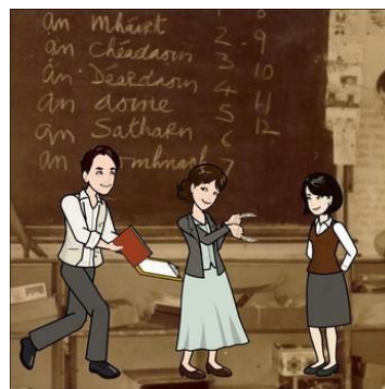
B'íad na tuismitheoirí agus na múinteoirí a choinnígh i ag dul, Ag tionsú airgid agus ag ceannach áiseanna bunúsacha don scoil, Leabhair, cathaireacha, tablaí agus pinn luaidhe, Rudai a bhí ag gach scoil Bhearla cheana féin ó thuaidh.

Easpa maoinithe, aitheantais agus tacaíochta ón tús, Ón Roinn Oideachais agus ón stát mar nár thuig siad an chúis, Cos ar bolg agus leatrom mar fhreagra náidúrtha ag an am sin, Ar an teanga agus ar an phobal a labhair i freisin.