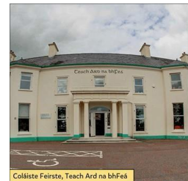
Coláiste Feirste, Teach Ard na bhFeá

O shin i leith, tá an scoil suite i dTeach Ard na bhFeá, Áit a gcothaítear meas, tuiscint agus grá, Don teanga, don phobal agus do na glúnta a tháinig romhainn, Ina measc muintir Mhic Sheáin, Uí Bruadair, Uí Mhionacháin agus Mhic Póitín.