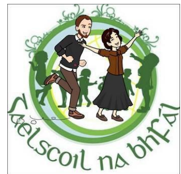
Chonacthas, mar sin go raibh seo indéanta agus rathúil, Agus go dtodhcaí le daoine amhlaidh a dhéanamh ina gceantair áitiúil, Agus sin an rud a tharla sa bhliain 1984, Bunaíodh Gaelscoil na bhFál, an dara bunscoil lán Ghaeilge sa chathair.