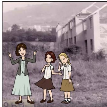
Ach níorbh ann do Ghaelscoil sa tuaisceart ag an am, "Cá mbeidh muid ag dul ar scoil ar an bhliain seo chugainn, a Mham?" "Ba mhaith linn go mbeidh Gaeilge againn sa teach agus scoil araon, Direach mar a rinne muid leis an Gaeltacht, tógfaidh muid ár gceann féin."