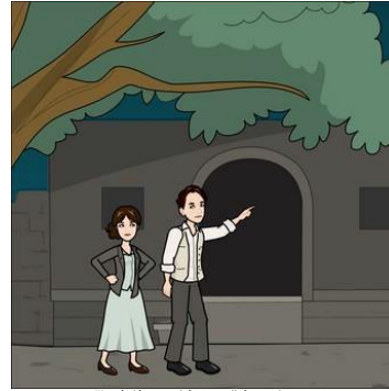
"Is gá dúinn rud éigin a dhéanamh, mar sin, Chun an fód a sheasamh ar son ár dteanga bhinn, Agus a todtchái a chinntiú do na glúnta atá le teacht, Rud éigin mór agus claochlaitheach."