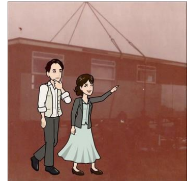
Agus sin go díreach an rud a rinne siad arís, Ag glacadh seilbhe ar a dtodhcaí le díograis agus fis, Agus rugadh Bunscoil Phobal Feirste sa bhliain 1971, I mótháin bheaga ar chúil tithe na dteaghlach féin.