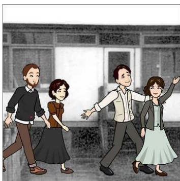
Iocadh na múinteoirí nuair a bhí go leor airgid ann, Chuntas siad na pingíní, ceann ar cheann, Ansin thosaigh na bunaitheoirí ag dul i bhfeidhm ar a gcairde, "Ó shiolta beaga a fhásann an crann is airde."