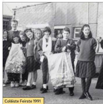
Coláiste Feirste 1991

Agus sa bhliain chéanna i ndiaidh thréimhse dheceair agus fhadálach, Más mall is mithid, bhain Bunscoil Phobal Feirste aitheantais oifigiúil amach, Ó na húdairis céanna a rinne neamhaird úirthe ón chéad tá, Céim stairiúil agus shuntasach, d'fhéadfá a rá.