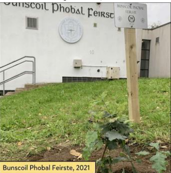
Bunscoil Phobal Feirste, 2021

O shin i leith, tá an scoil suite i dTeach Ard na bhFeá, Áit a gcothaítear meas, tuiscint agus grá, Don teanga, don phobal agus do na glúnta a tháinig romhainn, Ina measc muintir Mhic Sheáin, Uí Bruadair, Uí Mhionacháin agus Mhic Póitín.