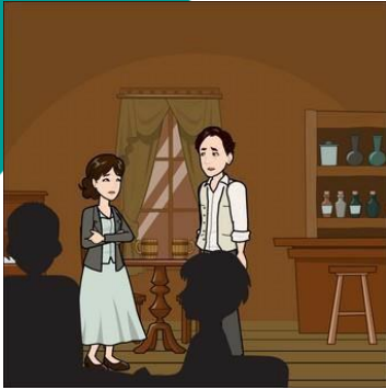
An Ghaeilge go mór faoi chois ag an stát, in úsáid go sóisialta ag pobal faoi bhrat, an Chumáinín Chluain Ard ar Bhóthar na bhFál, faoi rún is go ciúin ar feadh seil;