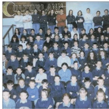
I gCultúrann Mac Adam Ó Fiaich a thosaigh an scoil amach, Anois tá muid ag cur oideachais ar bhreis agus 7,000 dalta, Bliain i ndiaidh bliana, bhí líon na ndaltaí ag fás, Chomh gasta sin go raibh siad ag rith amach as spás.

Ach leis an Gaeilgeoilocht ag dul ó neart go neart, Aithníodh nach raibh meánscóil lán-Ghaeilge ar bith sa tuaisceart, Mar sin le freastal ar na bunscoileanna a bhí sa chathair cheana féin, Bunaíodh Coláiste Feirste sa bhliain 1991.