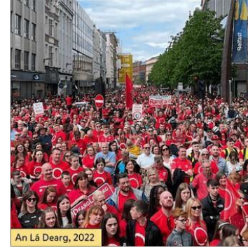
An Lá Dearg, 2022

Sheas siad an fód agus chuir siad an siol, Agus ag an am, i bhfirinne, is beag duine a shíl, Go mbeifeadh an earráil amach caoga bliain ar an fhód, Agus go mbeadh muid in ann féachaint siar le grá agus bród.