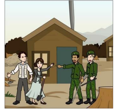
Is ar Bhóthar Seoiige a cheannaigh siad talamh, Áit ar thóg siad tithe le brici, suimint agus fuair siad lasacht ar threalamh, Agus d'ainneoin na n-íarrachtaí na teaghlai seo a stopadh, Lean siad orthu agus faoi dheireadh bhí Gaeltacht acu;