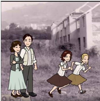
Gaeltacht bheag úrbeach a thosaigh le cúig theacht, I gceantar beag ar imeall na cathrach, Gaeltacht Bhóthar Seoiige an t-ainm a tugadh di, Nuair a bunaíodh i sa bhliain 1969.