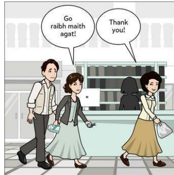
Agus cé go raibh Gaeilge ag na teaghlai ar fad; Leis an Bhearla thart timpeall orthu, gan staonadh gan stad, Nuair a bhí na páistí in aois na scoilaochta, bhí cinneadh le glacadh, Maidir leis an roga is fearr oideachais do theanga s'acú.