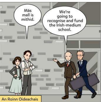
An Roinn Oideachais

Agus sa bhliain chéanna i ndiaidh thréimhse dheceair agus fhadálach, Más mall is mithid, bhain Bunscoil Phobal Feirste aitheantais oifigiúil amach, Ó na húdairis céanna a rinne neamhaird úirthe ón chéad tá, Céim stairiúil agus shuntasach, d'fhéadfá a rá.